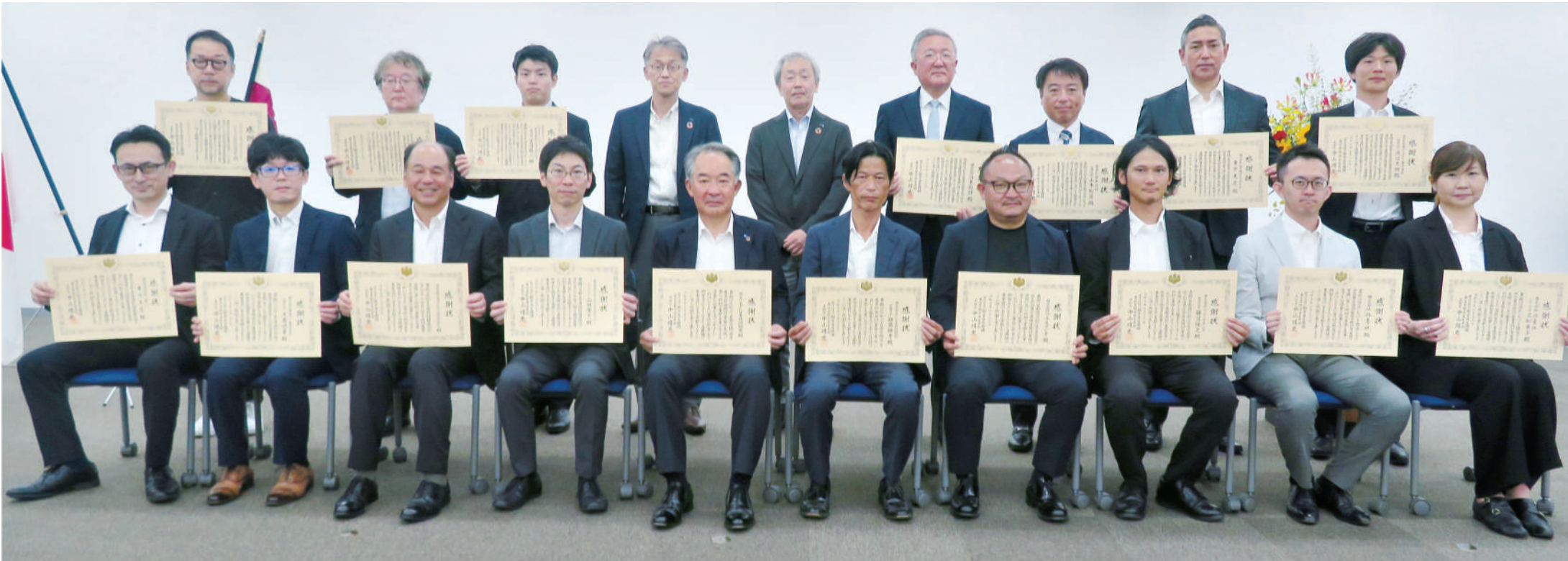
優秀業務受賞者による記念撮影

都市再生機構の東日本賃貸住宅本部と都市再生本部は7月27日、2023年度優秀工事施工者感謝状等贈呈式と優秀建設コンサルタント業務等事業者感謝状等贈呈式を開催した。両本部あわせて35件32社が表彰された。東日本賃貸住宅本部の優秀工事施工者感謝状等贈呈式は関東地域で13件10社、東京・その他地域で13件13社の計26件21社が受賞。都市再生本部の優秀建設コンサルタント業務等事業者感謝状等贈呈式は9件9社が受賞の栄誉に浴した。